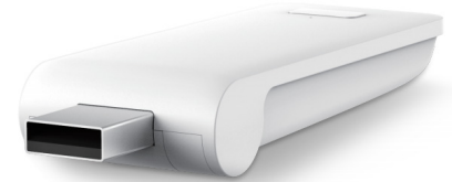
Mini Bridge Connector