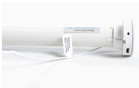
Motorn i din rullgardin